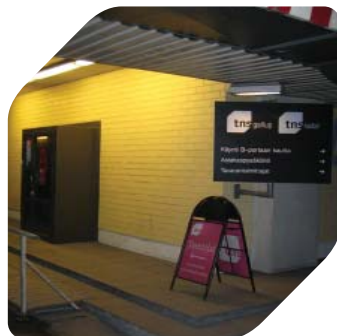
Testitilojen A-ralun sisäänkäynti autohallissa