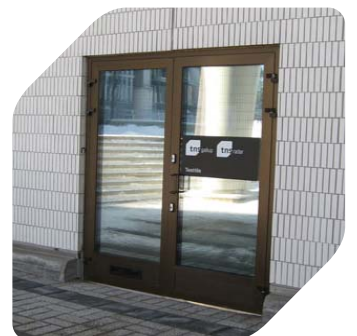
Testitilojen ovi katutasossa