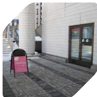
Testitilojen sisäänkäynti katutasossa